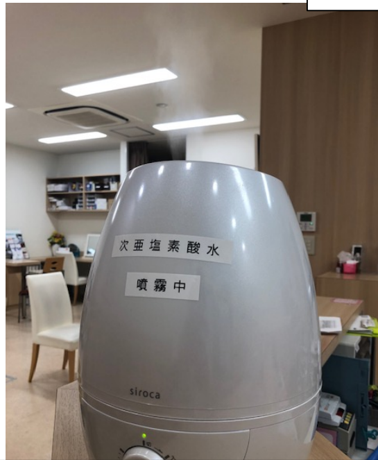
次亜塩素酸水噴霧 30ppm