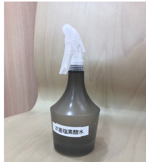
次亜塩素酸水消毒100ppm